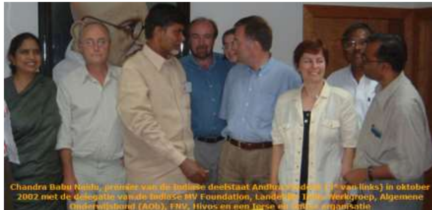
Chandra Babu Naidu, premier van de Indiase deelstaat Andhra Pradesh (2 e van links) in oktober 2002 met de delegatie van de Indiase MV Foundation, Landelijke Indiase Werkgroep, Algemene Onderwijsbond (AOOb), FNV, Hivos en een Ierse en Duitse organisatie.

In oktober 2002 bracht een delegatie van LIW, AOOb (de Algemene Onderwijsbond), FNV en MVF een bezoek aan de premier van Andhra Pradesh, die beloofde dat alle werkende kinderen in AP naar school zouden gaan in 2005, dit was een van de