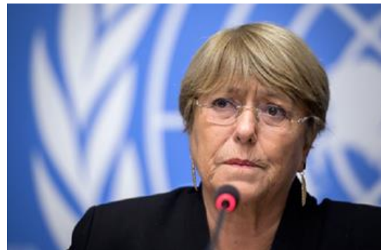
VN Hoge Commissaris voor de Mensenrechten, Michelle Bachelet

De VN Hoge Commissaris voor de Mensenrechten, Michelle Bachelet, heeft zich sterk uitgesproken over de nieuwe aanpassing en de consequenties voor het maatschappelijk middenveld in India: https://news.un.org/en/story/2020/10/1075792 .