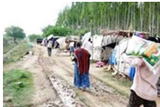
Families die voor hun levensonderhoud afhankelijk zijn van brandhout van Subabul bomen raakten vanwege COVID-19 hun inkomen kwijt.

Sinds 2018 werkt Arisa samen met Arte Groep (bedrijf dat natuurstenen werkbladen produceert) en de Indiase organisatie MV Foundation aan het creëren van een kinderarbeidvrije zone in en rondom de natuursteen groeves in het Prakasam district in Andhra Pradesh waar Arte Groep haar graniet inkoop. MV Foundation heeft onlangs haar jaarrapport gestuurd met een overzicht van activiteiten. Veel werkzaamheden stonden in het teken van COVID-19, zoals het regelen van essentiële voorzieningen voor families die inkomen verloren vanwege de lockdown, het 'bevrijden' van kinderen die omdat de scholen werden gesloten weer tewerkgesteld werden, het voorkomen van kindhuwelijken, en de oriëntatie van speciaal aangestelde overheidsambtenaren op aan onderwijs gerelateerde zaken.